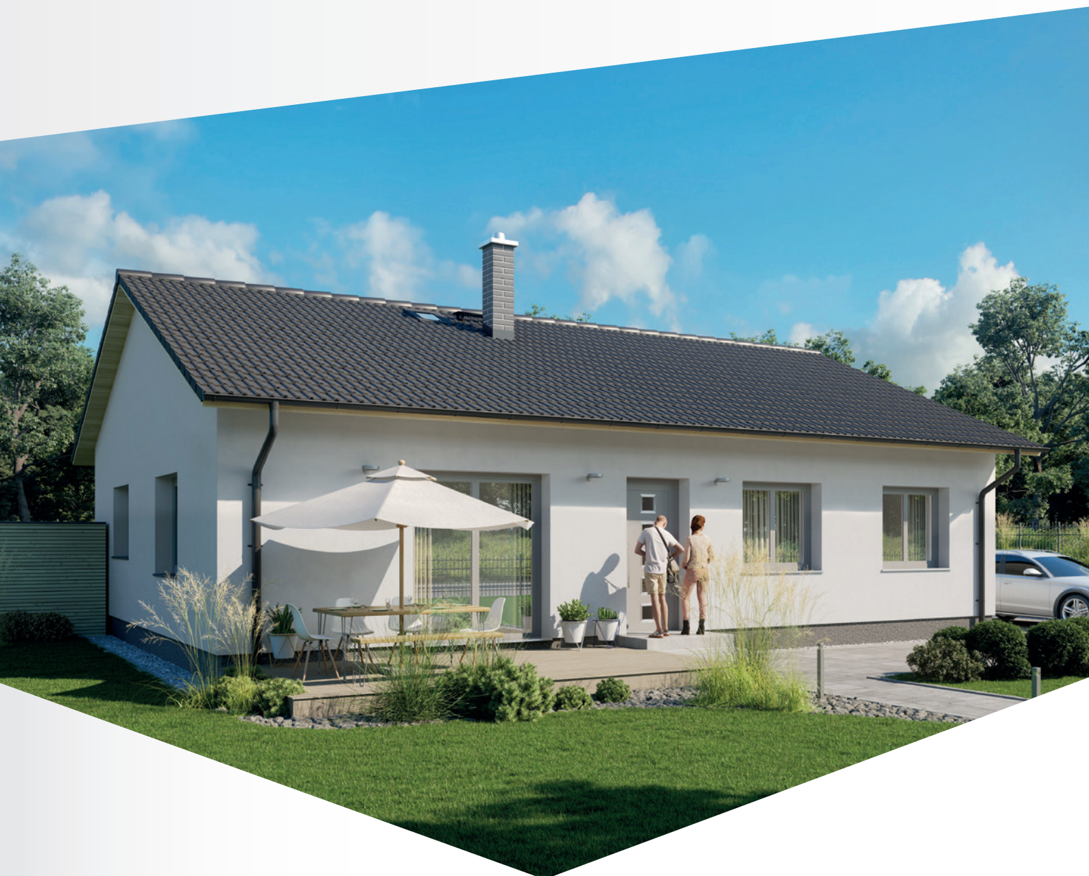
PROVEDENÍ SE SEDLOVOU STŘECHOU